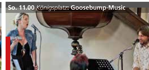
So. 11.00 Königsplatz: Goosebump-Music