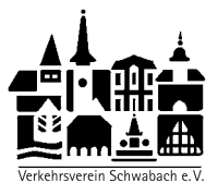
Verkehrsverein Schwabach e.V.

Leitner-Bier zum Bürgerfest im traditionellen 1 Biergarten am Rathaus , Bratwürste und anderes bei 2 Ennichs Vesper-Häusla . Leckeres bei 3 Massimos Nudelpfanne . Bei den 4 Schwabanesen feine französische Crêpes und gesunde Salate in allen Variationen. Immer dabei: 5 Pizzabäckerei der A.F.I.S. Im 6 Musiker-Hof am Königsplatz: Viel Musik und Köstlichkeiten. Am Pferdebrunnen: 7 griechische Spezialitäten vom Restaurant Meteora . Gastronom Trutschel ist im 8 Goldenen Stern und im 8a Blues-Biergarten aktiv. In der Höllgasse: 9 Restaurant Ognibene mit italienischen Speisen. Am Gambrinus-Bierbrunnen: Jürgen Müllers 10 Brauerei Hembach mit ganz besonderen Bieren. Am Aufzug auf dem Königsplatz: Spezialitäten vom 11 Hotel Raab (Inspektorsgarten). Zünftige Vesper-Spezialitäten, Cocktails und Weine gibt es in der 12 Wolkersdorfer Almhütte . Bei 13 amnesty international feine Waffeln. In der Königstraße neben dem Uhl-Haus mit kleiner Fotoausstellung dabei: 14 Das Café . Feine Küche rund ums Mittelmeer serviert das neue Restaurant 15 Fabiano .