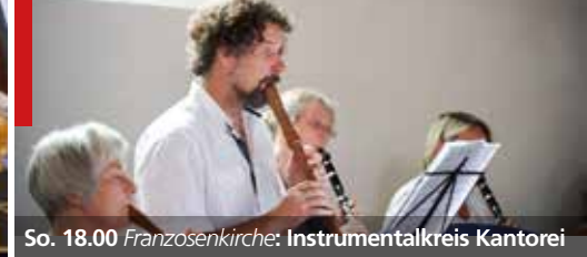
So. 18.00 Franzosenkirche : Instrumentalkreis Kantorei