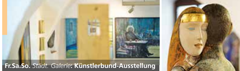
Fr.Sa.So. Städt. Galerie: Künstlerbund-Ausstellung