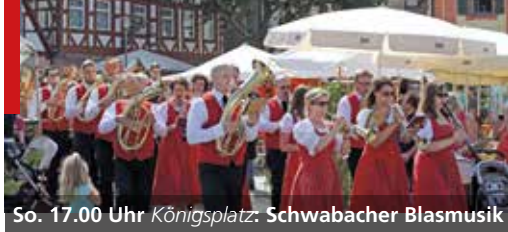
So. 17.00 Uhr Königsplatz : Schwabacher Blasmusik