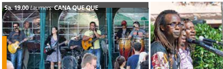
Sa. 19.00 Laumers: CANA QUE QUE