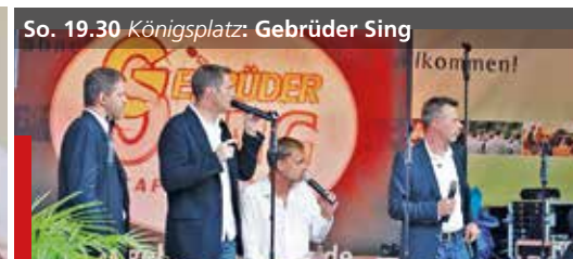
So. 19.30 Königsplatz : Gebrüder Sing