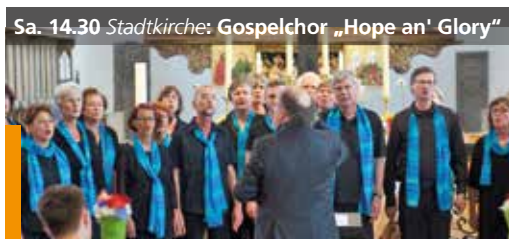
Sa. 14.30 Stadtkirche: Gospelchor „Hope an' Glory“