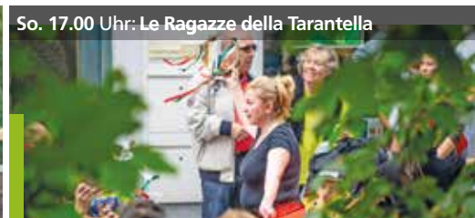
So. 17.00 Uhr: Le Ragazze della Tarantella