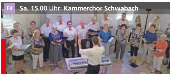
FK Sa. 15.00 Uhr: Kammerchor Schwabach