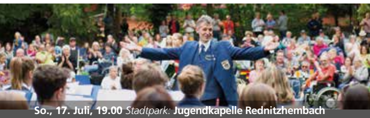
So., 17. Juli, 19.00 Stadtpark: Jugendkapelle Rednitzhembach

Am Pavillon im schönen Schwabacher Stadtpark als Einstimmung auf das große Fest: