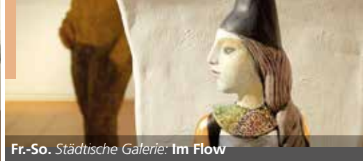
Fr.-So. Städtische Galerie: Im Flow