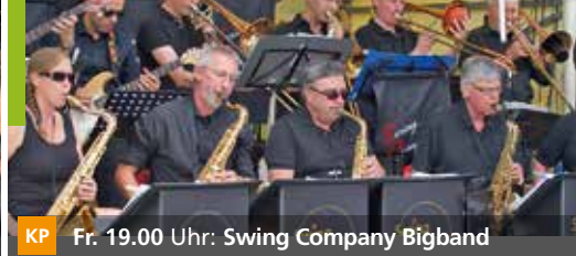
KP Fr. 19.00 Uhr: Swing Company Bigband