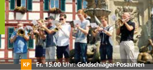
KP Fr. 15.00 Uhr: Goldschläger-Posaunen