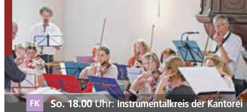
FK So. 18.00 Uhr: Instrumentalkreis der Kantorei