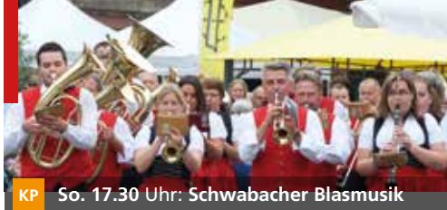
KP So. 17.30 Uhr: Schwabacher Blasmusik