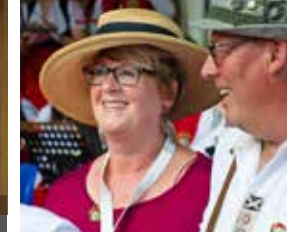
FK Sa. 19.00 Uhr: Kammerchor Schwabach