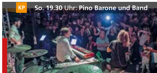
KP So. 19.30 Uhr: Pino Barone und Band