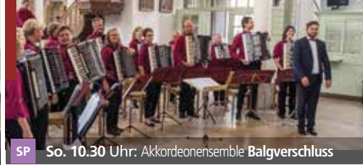
SP So. 10.30 Uhr: Akkordeonensemble Balgverschluss