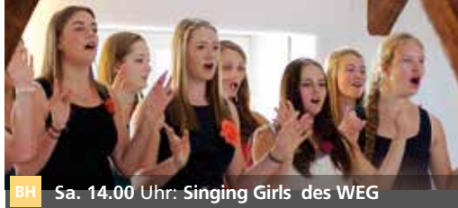
BH Sa. 14.00 Uhr: Singing Girls des WEG