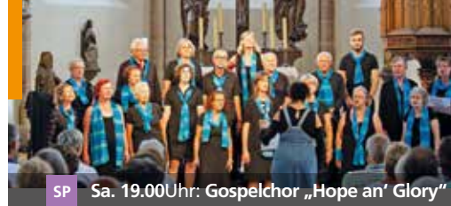
SP Sa. 19.00Uhr: Gospelchor „Hope an' Glory“