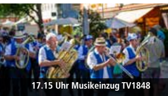
17.15 Uhr Musikzug TV1848