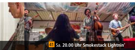
41 Sa. 20.00 Uhr Smokestack Lightnin'