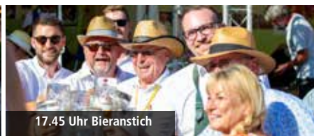
17.45 Uhr Bieranstich