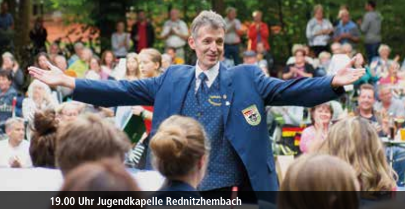
19.00 Uhr Jugendkapelle Rednitzhembach