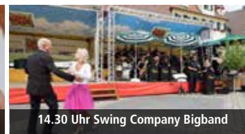
14.30 Uhr Swing Company Bigband