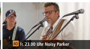
40 Fr. 23.00 Uhr Noisy Parker