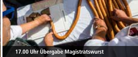
17.00 Uhr Übergabe Magistratswurst