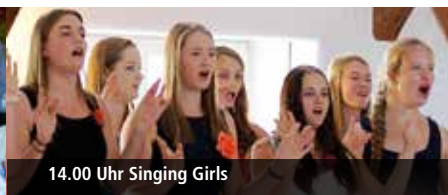
14.00 Uhr Singing Girls