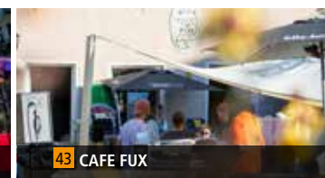
43 CAFE FUX